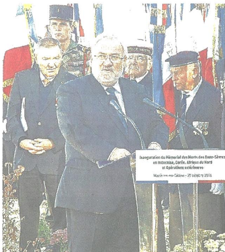
Samedi 29 octobre, le ministre Jean-Marc Todeschini est présent à l'inauguration du Mémorial. Et la délégation polonaise, en réunion de travail, lors de sa visite la semaine dernière.